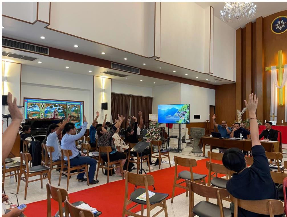
Vammaislinjaus sai vahvan tuen kirkolliskokouksessa ja linjaus hyväksyttiin selkein äänin.