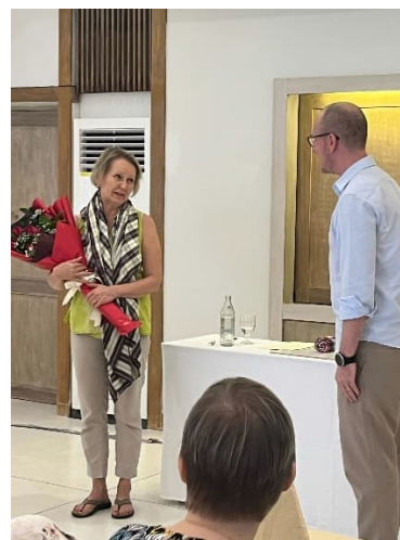
Sain yllätyksekseni myös kukat 30-vuotisesta työrupeamasta Lähetysseurassa (tulee täyteen heinäkuussa)