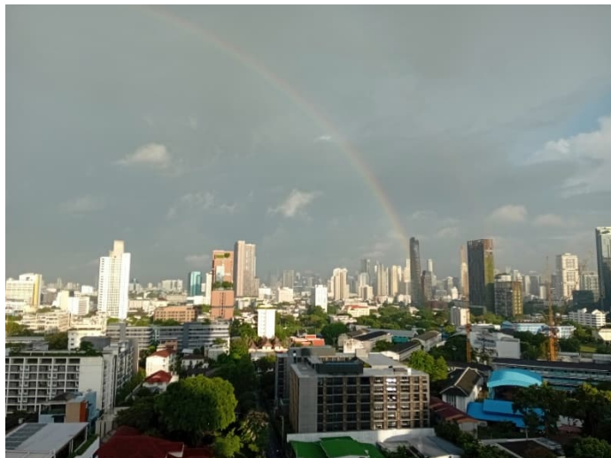
Näkymä parvekkeeltani: Rankan sateen jälkeen Bangkokin yllä näkyi hento sateenkaari.

Kevät on edennyt hurjaa vauhtia ja minun pitikin oikein tarkistaa kalenterista, että edellisen kirjeen kirjoittamisesta on todella jo kolme kuukautta. Poikkeuksellisen pitkän viileän jakson jälkeen olemme jo kerenneet kuumimmasta ajasta juuri alkaneeseen sadekauteen.