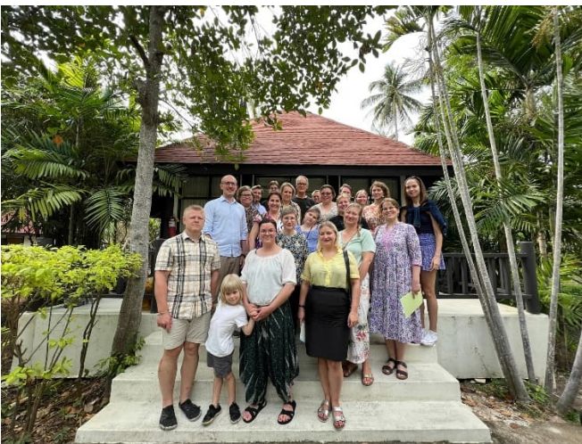
Yhteiskuva Aasian alueen tiimistä perheineen

Helmikuussa kokoonnuimme myös Lähetysseuran Aasian alueen ensimmäisille yhteisille työntekijäpäiville. Päivät järjestettiin Hua Hinissä, Thaimaassa. Mukana olivat työntekijämme Nepalista, Kambodzhasta, Hongkongista ja Thaimaasta. Päivien aikana keskityttiin miettimään erityisesti yhteistyötämme yhteisten tavoitteiden saavuttamiseksi.