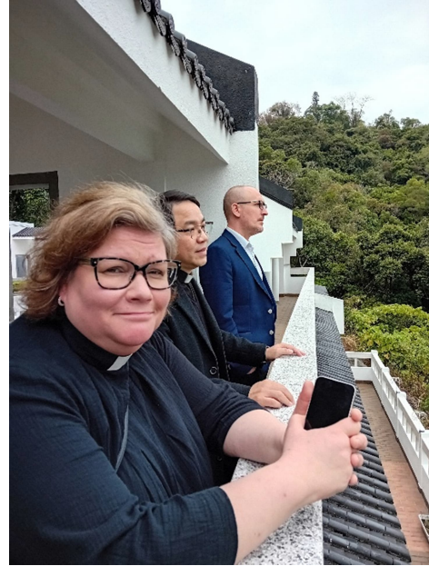
Seminaarin mäeltä on hyvä katsoa yhdessä myös kauemmaksi.